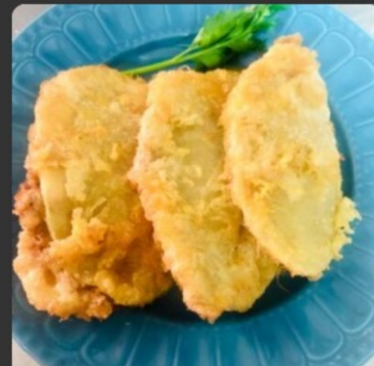
Patates farcides de carn