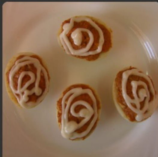
Ous farcits de carn o tonyina