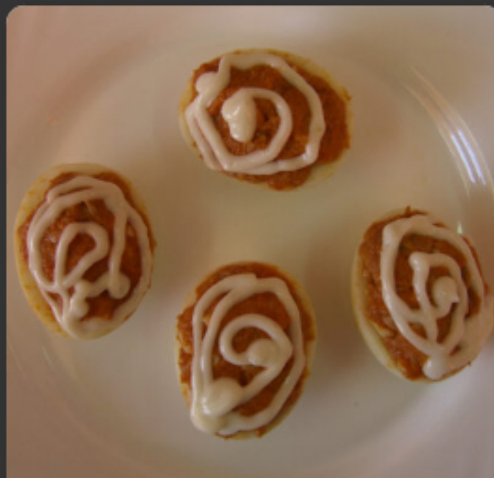
Ous farcits de carn o tonyina