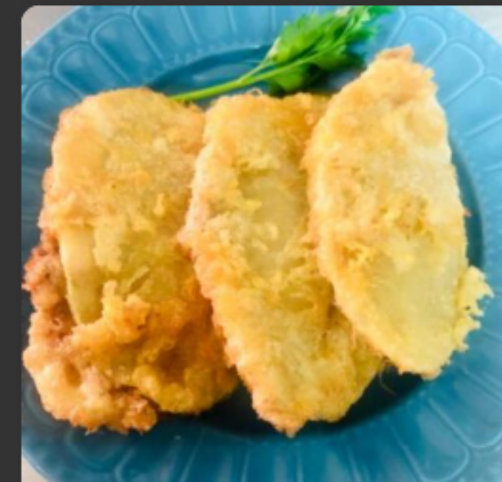
Patates farcides de carn