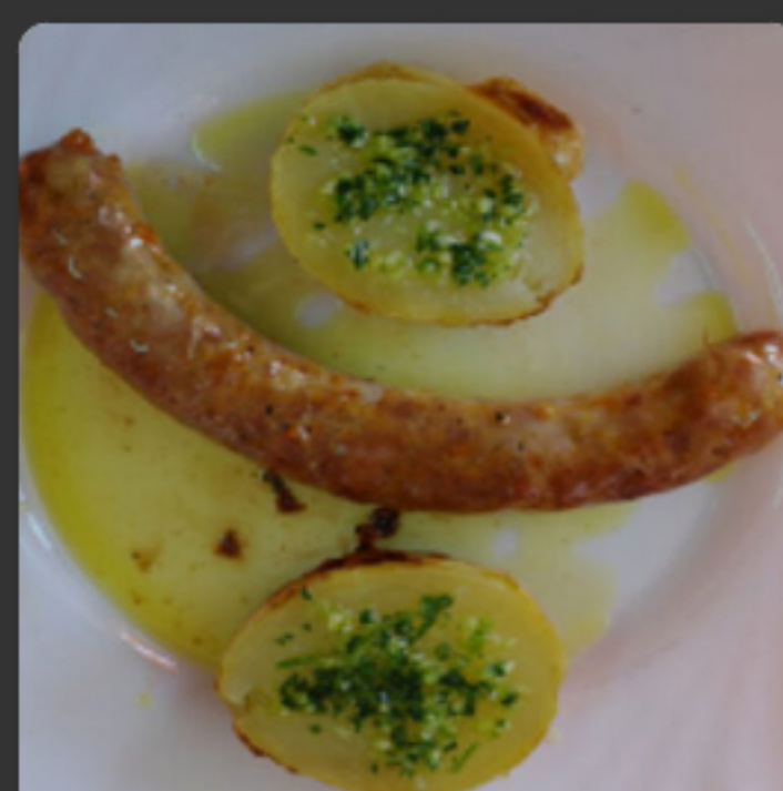
Botifarra a la brasa